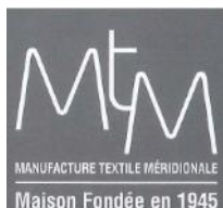
「マンファクチャー・テキスタイル・メリディオナル」