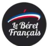
「ル・ベレー・フランセ」