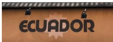
「エクアドル・シャポー」