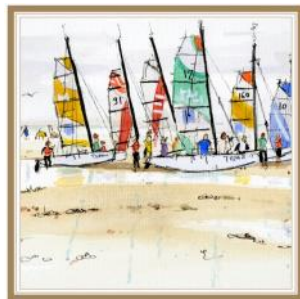
ECOLE DE VOILE